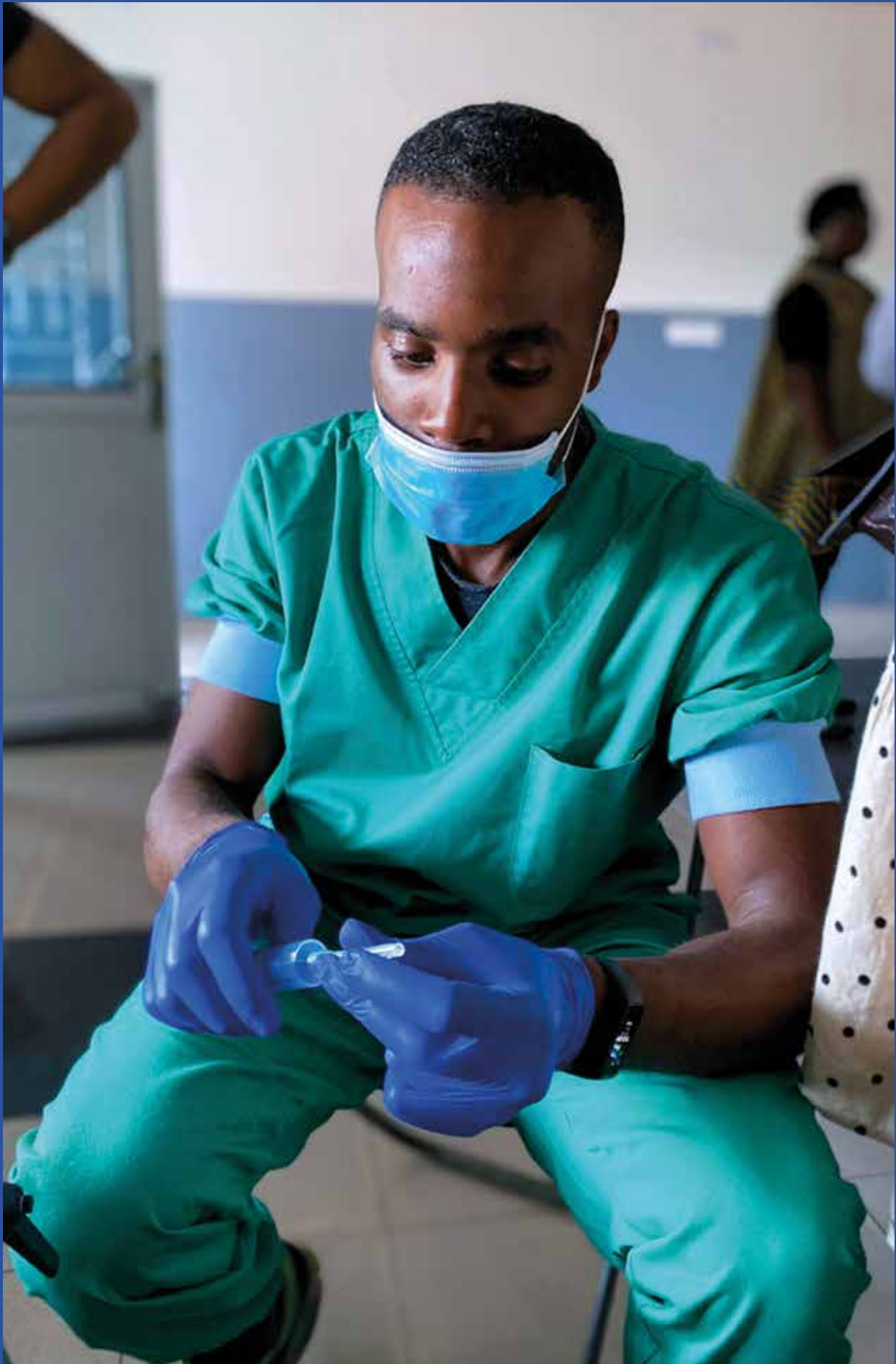
Mission octobre 2021 - Centre Hospitalier PQ