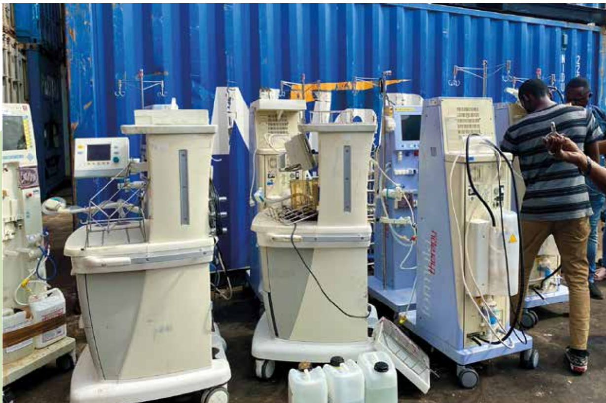
Mission octobre 2021 - Déchargement du matériel médical venu de France

Et bien d'autres dons ont été reçus mais trop nombreux pour être énumérés. Pour information, il y a actuellement du matériel médical arrivé en fin d'exploitation dans certains hôpitaux, qui demeure en très bon état et encore exploitable. Ce sont des appareils, dont la seconde vie donnera également de nouveaux sourires.