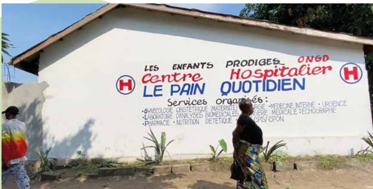
Mission octobre 2021 - Centre Hospitalier PQ

Selon un rapport de l'agence Belge du développement, publié en 2015, le paludisme (plus de 40% des causes de mortalité infantile), le syndrome d'immunodéficience acquise (SIDA), le diabète et la tuberculose sont considérés comme étant des problèmes majeurs de santé publique. La population congolaise, tout comme celle d'autres pays d'Afrique souffre encore de ce type de pathologies, alors même qu'en Europe, ces dernières sont correctement prises en charge et pour certaines ont quasiment disparu.