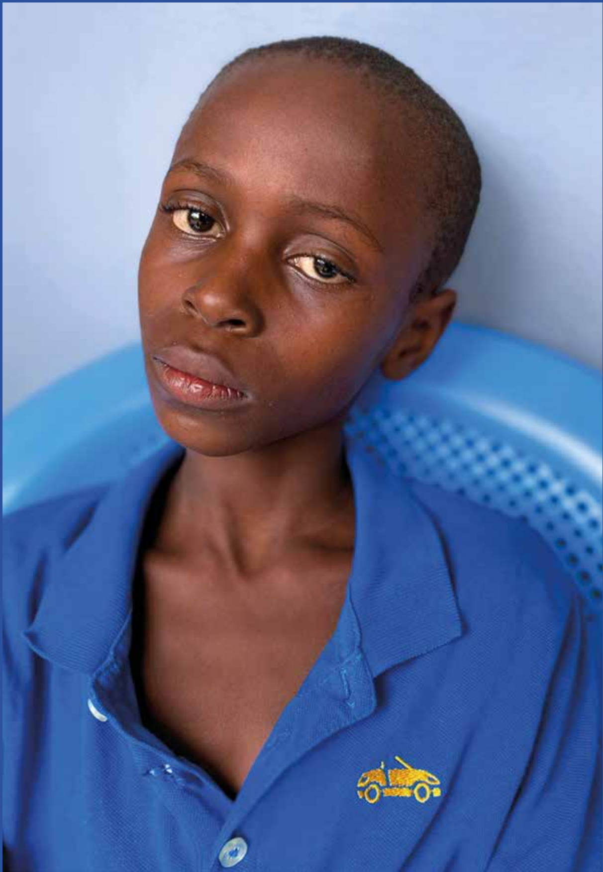
Mission octobre 2021 - Centre Hospitalier PQ